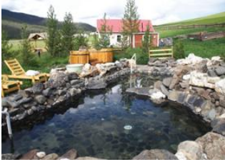
Khogno Khan 📍 🚗 250km - ⌚ 4h Tsenkher 📍