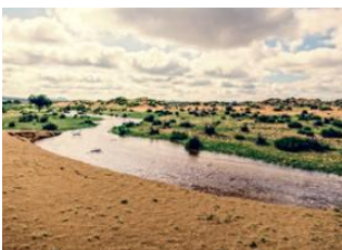
Ulaanbaatar 📍 🚗 280km - ⌚ 4h 30m Khogno Khan 📍