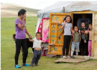
Tsenkher 📍 🚗 40km - ⌚ 1h Tsetserleg 📍 🚗 120km - ⌚ 3h Ondor Ulaan 📍