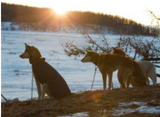
Bosgiin Guur 📍