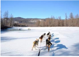
dog sled base camp 📍